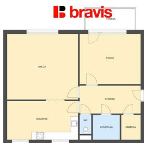
2+1, Višňová, Brno-Medlánky, 76 m 2