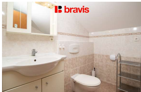
2+kk ul. Botanická, Brno - Ponava, 40 m 2